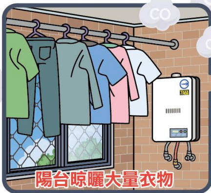
陽台晾曬大量衣物