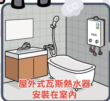
屋外式瓦斯熱水器 安裝在室內