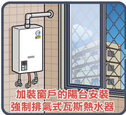
加裝窗戶的陽台安裝 強制排氣式瓦斯熱水器