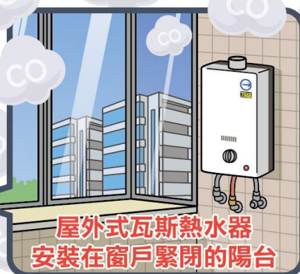
屋外式瓦斯熱水器 安裝在窗戶緊閉的陽台