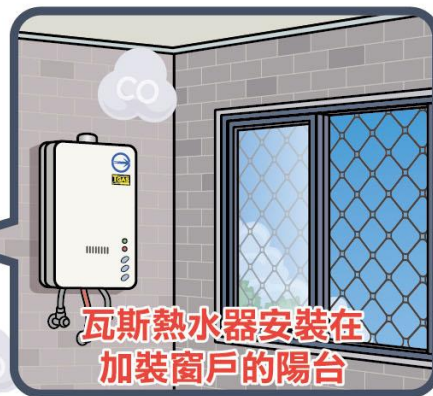
瓦斯熱水器安裝在 加裝窗戶的陽台