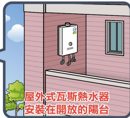
屋外式瓦斯熱水器 安裝在開放的陽台